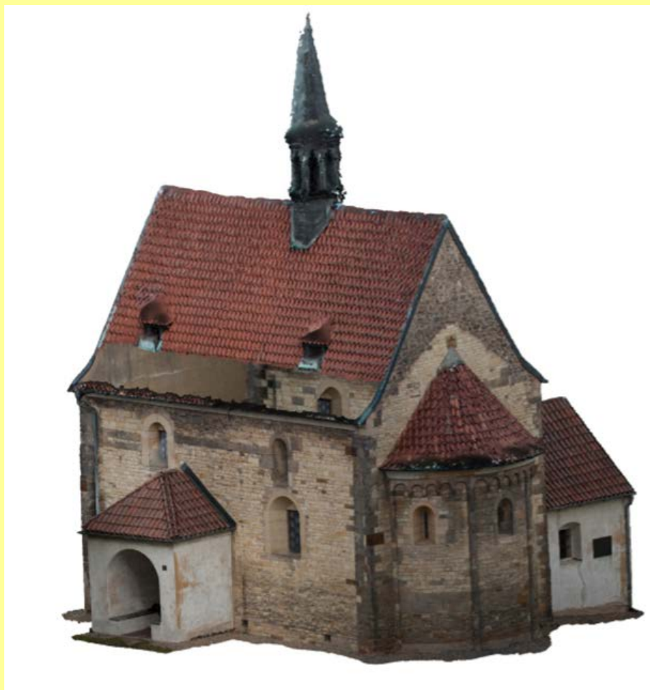
Obr. 1:- Prostorový model kostela vytvořený fotogrammetrickým způsobem