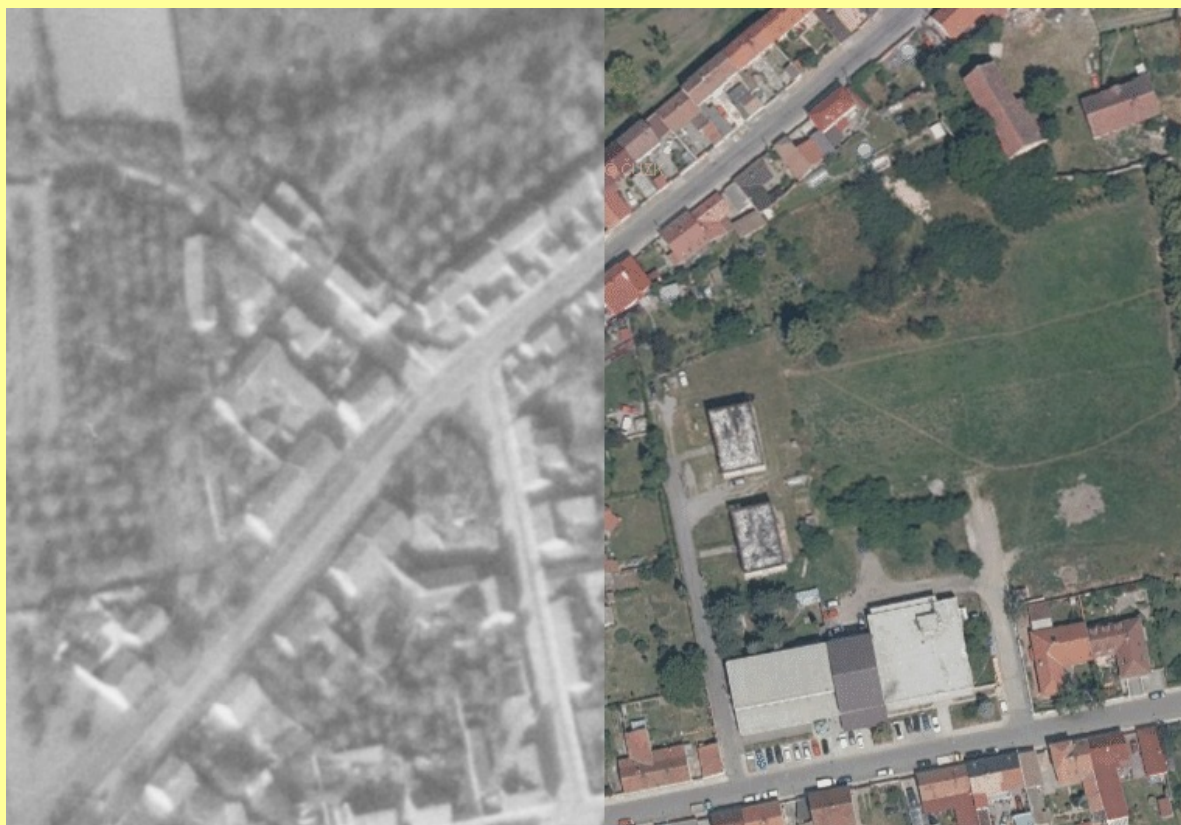
obr.: Ukázka napojení vytvořeného historického ortofota na aktuálně platné ortofoto ČR.