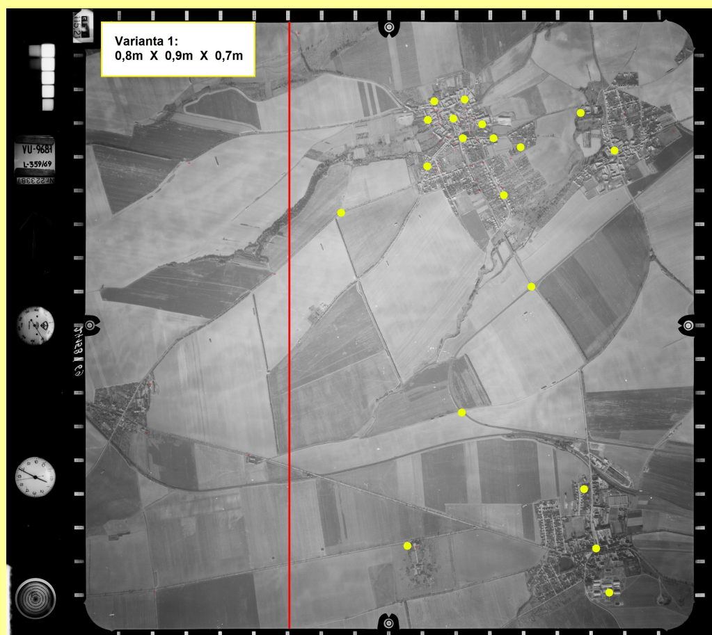
obr.: Výběr vlíčovacích bodů pro variantu „stereodvojice“.