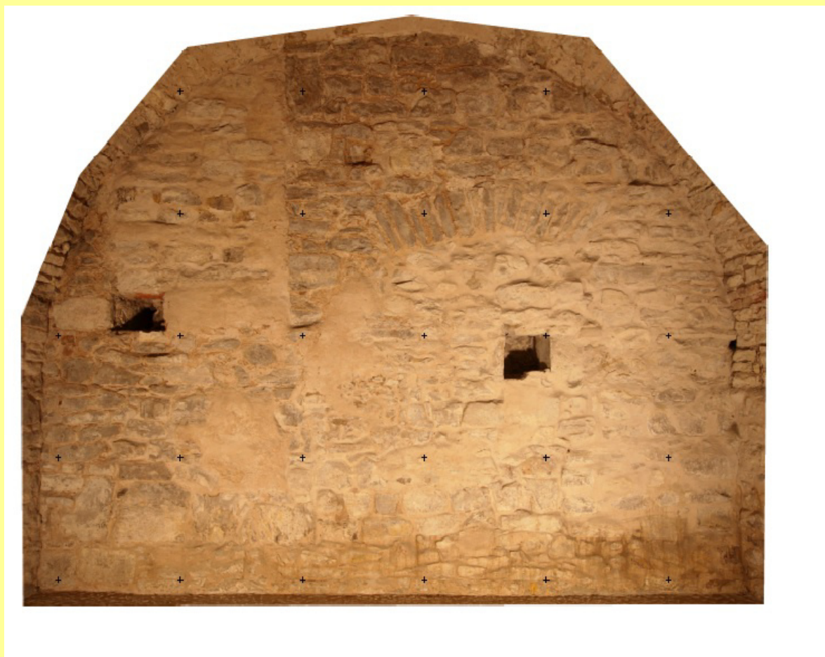
Obrázek 3: Fotoplán západní stěny místnosti 01

pozn.: text spolu s dalšími výsledky práce v digitální podobě mohou být na vyžádání poskytnuty (vedoucím práce).