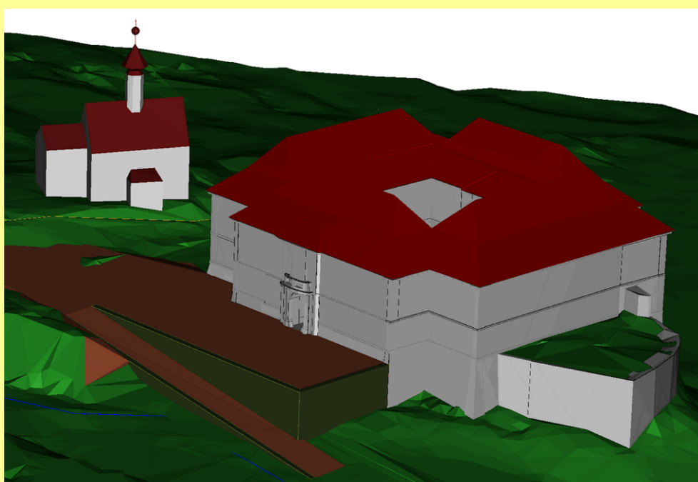
Obr. 3: Náhled terénní úpravy před zrekonstruovaným barokním zámekem, pohled od severu, bez měřítka