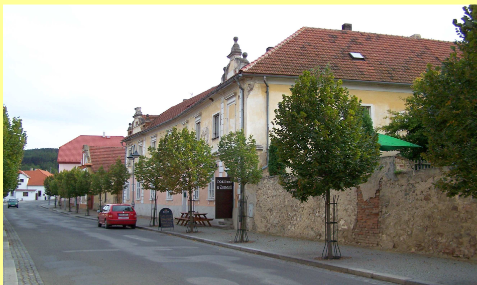
Obr.1: manský dvůr č.p. 2