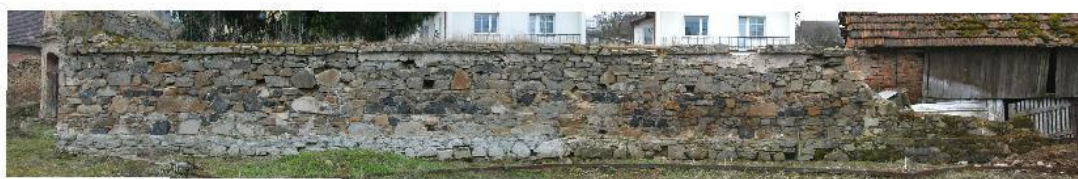
Výsledný fotoplán části ohradní zdi.

pozn.: text práce spolu s dalšími výsledky práce v digitální podobě mohou být na vyžádání (vedoucí práce) zaslány.