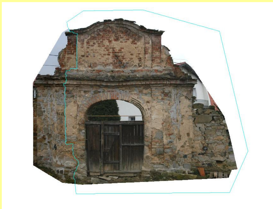
Výsledné ortofoto s ukázkou řezu pro maskování dvou snímků.