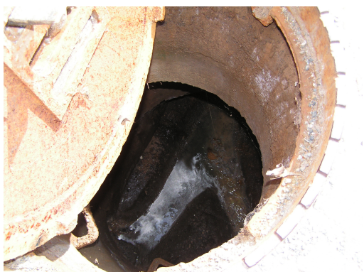
Obr. 8 Spojná komora (2 přítoky a 1 odtok)