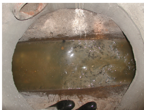
Obr. 9 Kanalizační šachta přímá