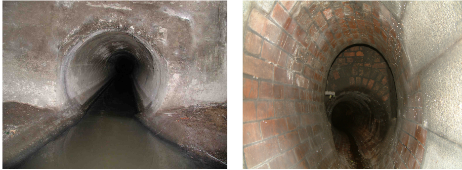
Obr. 1 Tvar profilů stok (kruhový, přechod vejčitého do kruhového, tlamový)

Hydraulickému hledisku nejvíce vyhovuje nejvíce vejčitý tvar, nejméně pak tlamový. Pro bezproblémový odtok bezdeštných splašků ve zděných a monolitických stokách velkých světlostí, prakticky všech tvarů stok, se navrhuje žlábek, tzv. kyneta.