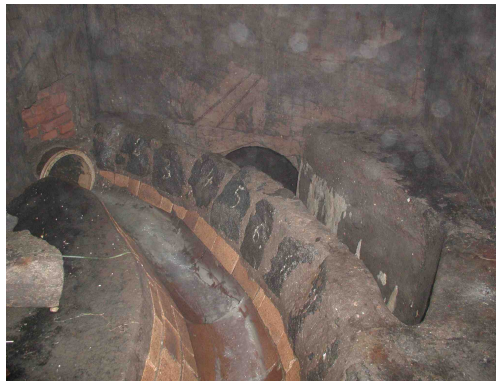
Obr. 4 Odtok z odlehčovací komory