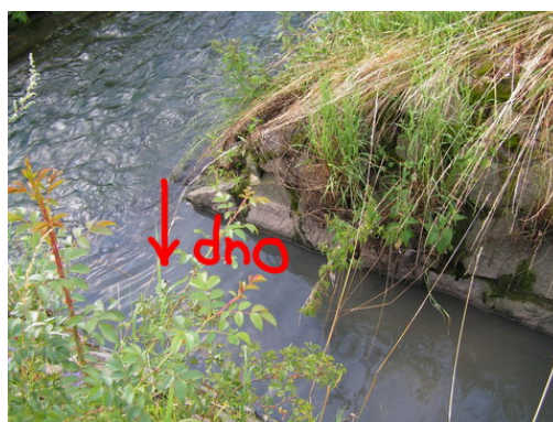
Obr. 10 Ukázka různých druhů výustí – šipka označuje, které místo je bráno za dno výustě