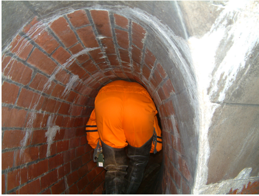
Obr. 2 Průlezný profil