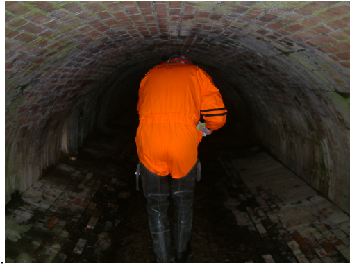
Obr. 3 Průchozí profil