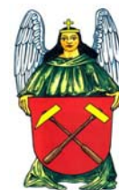
Obr. 1, 2, 4

Poloha, kdy želízko směřuje šikmo k pravému rameni pozorovatele (obr. 1), je uplatněna např. ve znacích Českého báňského úřadu a významných středoevropských montánních učilišť: hornicko-geologické fakulty VŠB-TU Ostrava (obr. 2), AGH Kraków, fakulty BERG TU Košice, TU-BA Freiberg. Roku 2001 však převzala střeďočekáská obec Chrusterice rozhodnutím Parlamentu ČR znak (obr. 3), na němž je orientace kladívek zrcadelně opačná. Stejně je tomu i na