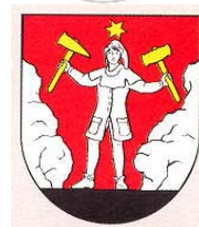
Obr. 30, 31