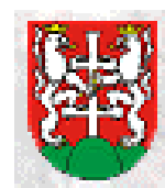
Obr. 8, 10, 12, 14

Státní symboly ve znaku hornického města nacházíme poměrně často; jistě je to důkazem jejich významu. Ku příkladu českého lva nese znak zmíněných Vodňan a Nového Knína (včetně „knížecího“ pláště, obr. 7), Duchcova, Jihlavy, Stříbra a Jílového, v tomto