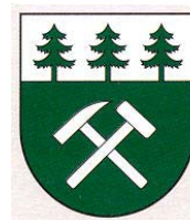
Obr. 24, 25, 26, 27