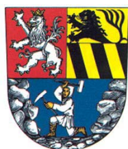
Obr. 28, 29

Celkově tento malý přehled potvrzuje - hlavně zásluhou saských znaků - v úvodu naznačenou