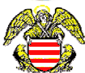
Obr. 6, 7, 9, 11, 13