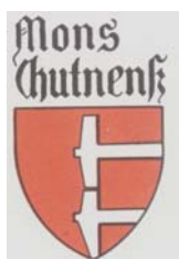
Obr. 20, 21, 22, 23

Poněkud jinou záštitu deklaruje znak Božího Daru vousatou tváří žehnajícího Boha Otce (obr. 15), ve znaku Štěchovic je Slunce (obr. 16). Panna Maria je erbovní figurou např. Marienbergu (obr. 17), Hora Matky Boží, Hnilčíku a Medzevu (obr. 18). Postavy světců a světic (např. Annaberg, Hora sv. Kateřiny, Hora sv. Šebestiána – obr. 19, Horní Jiřetín se sv. Jirím) jsou obecně často užívány, andělé jsou mnohdy štítonoši (obr. 5, 13). V tabulce 1 však nejsou tyto znaky registrovány.