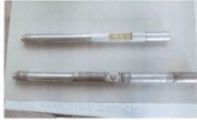
Příloha Single Shot prováděná v MND s.s. (nahraze typ Motion Sensor, dříve typ Elektronik Timer)