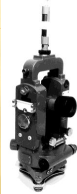
Meopta T1c →